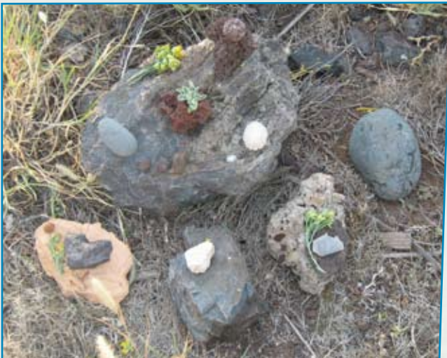
Teamstruktur Landart, 2010

Lassen Sie sich überraschen welches Lösungspotential in diesen leicht umsetzbaren Methoden liegt. Strukturthemen, organisatorische Aufgabenverteilung, Teamkonflikte genauso wie Fallbesprechungen bekommen eine neue Dynamik und können ganzheitlich betrachtet und weiterentwickelt werden.