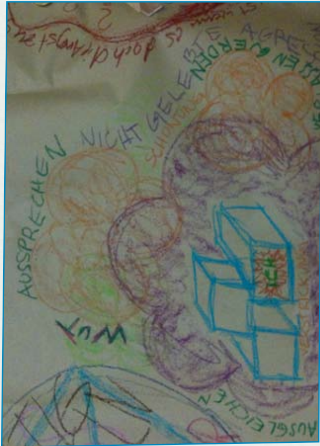
Ausschnitt Gemeinschaftsbild „Hindernisse“, 2014

Mit unseren Seminaren bieten wir Raum für die Entwicklung von Bewusstsein für innere Potentiale, Kreativität und deren unterstützende Kraft. Durch die natürliche Verbindung mit den Ressourcen entstehen lösungsorientierte Prozesse, die Veränderungen erfahrbar und umsetzbar machen. Der Dialog mit der inneren und äußeren Natur ist uns dabei ein besonderes Anliegen. Die regenerierende Erfahrung aus prozesshaften Begegnungen mit Licht und Schatten spiegelt sich in den Rückmeldungen der Teilnehmer*innen.