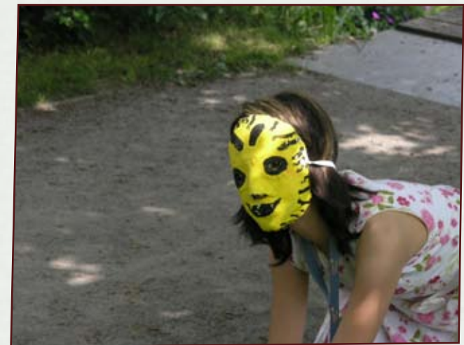
Maskenarbeit, Richard-Schule, 2011

Fr. 17 - 21 Uhr, Sa./So. 10 - 18 Uhr :: Kosten: 320 €