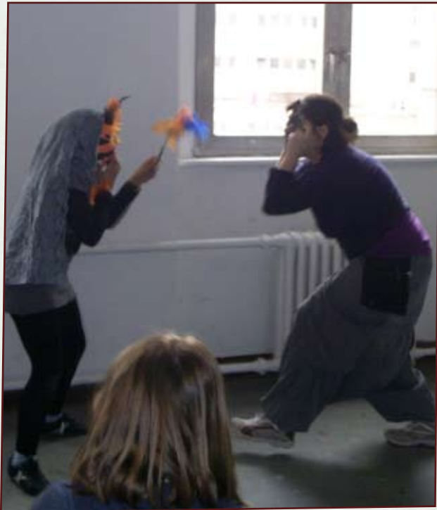
Maskenspiel, Richard-Schule, 2011

Gesamtpaket Modul 1 bis Modul 4: 920 € Ratenzahlung ist auf Anfrage möglich Module sind einzeln buchbar.